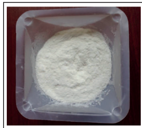
Figura 1. Apariencia del Guar Chem HSLV Plus