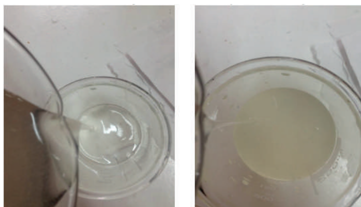
Figura 3. Solución al 1% m-v luego de 4 horas de envejecimiento en agitación continua.