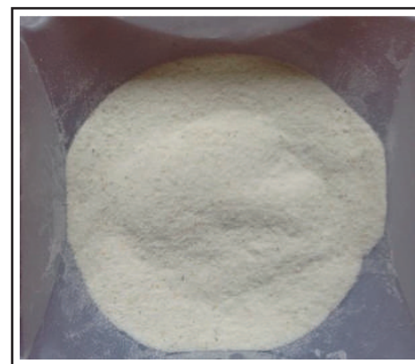
Figura 1. Apariencia del Guar Chem HQ 70